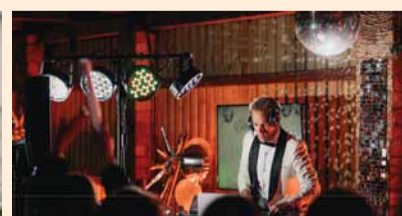
DJ Haizivbende 03.20–05.00