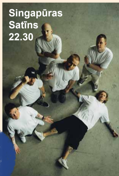
Singapūras Satīns 22.30