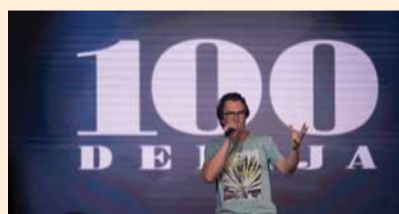
100 Debija 19.00