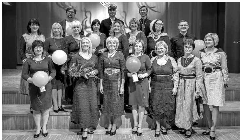
Skultes „Adiāminde” un „Druvas tonis”

„Druvas tonis” vokālisti un visu ansambļu vadītāji balvā saņēma mazos Sudraba putnus. Dziedāšanas svētkus noslēdza ansambļu un publikas dziedātās kopdziesmas ar Arni Miltiņu. Tā bija