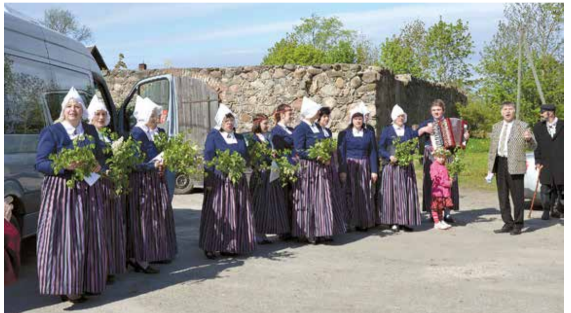
Ceļu sāka arī Dziedošais autobuss ar Limbažu kultūras nama sieviešu kora „Kalme” dziedātājiem un Viļķenes amatiereteātra aktieriem. Autobuss piestāja dažādās Viļķenes pagasta apdzīvotajās vietās un priecēja klausītājus ar spirtgām dziesmām. Pirmā pietura bija pie Katrīnkroga Viļķenē.