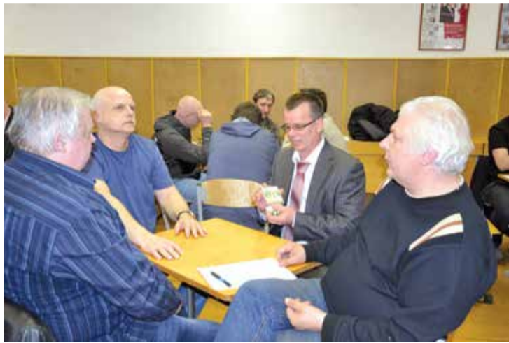
Himnas Goda dienas rīts sākās ar Valsts himnas autora Baumaņa Kārļa Vislatvijas piemiņas turnīra zolitē atklāšanu. Turnīrā piedalījās 52 spēlētāji.