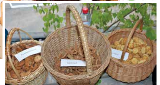
Latvijas valsts simtgades jauniešu rīcības komiteja ar svētku apmeklētājiem pārrunāja simtgades svinēšanas idejas, kā arī cienāja ar iedvesmas, drosmes un patriotisma cepumiņiem.