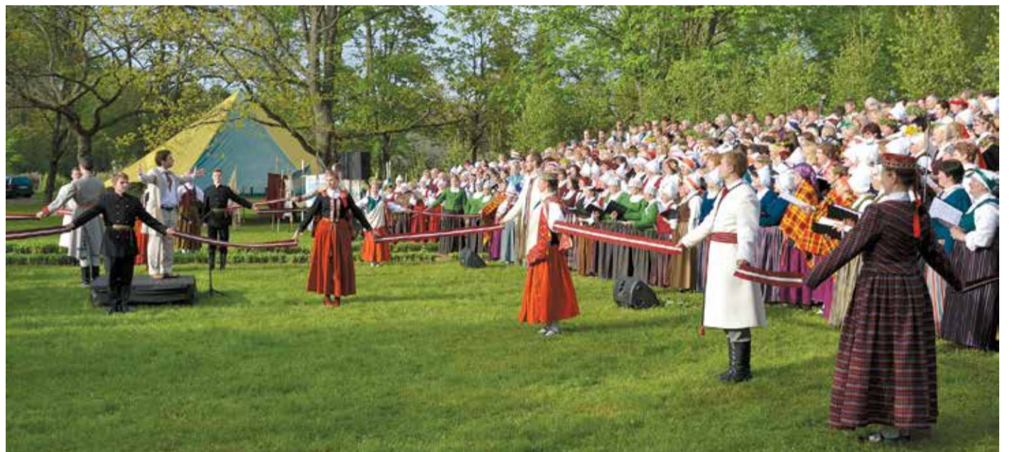
Koncerts „Un tauta dziesmu godā cels”.

23. maijā izskanēja Himnas Goda diena, kas bija veltīta Latvijas tautas lūgšanas autora Baumaņu Kārļa 180. dzimšanas dienai. Sarīkojums bija pirmais no Latvijas valsts simtgades svētku ieskaņas pasākumiem. Himnas Goda dienas un Baumaņu Kārļa dzimšanas dienu svinības Limbažu novada Viļķenē rīko reizi piecos gados. Arī šogad pasākuma programma bija piepildīta gan ar dažādiem tradicionāliem, gan arī neparastiem pasākumiem, lai parādītu un ļautu iepazīt Baumaņu Kārļa neparasto, daudzšķautņaino personību.