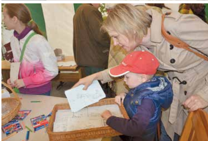
Dienas garumā pie Viļķenes kultūras nama darbojās Baumaņu Kārļa viesistaba, kuru iekārtoja Limbažu muzeja speciālisti, izvietojot ekspozīciju par Baumaņu Kārli un mācot glītrakstīšanu. Viesistabā varēja nofotografēties un tikt pie bildes sendienu stilā, kā arī ieaust savu pavedienu himnas jostā. Bet bērni varēja apzīmēt saldumu tūtas, izkrāsot un nosūtīt pa pastu pastkartes.