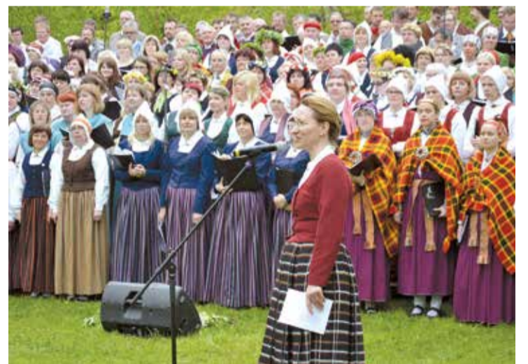
Sarīkojuma goda viesu vidū bija Kultūras ministre Dace Melbārde.

Ministre vēlēja himnai saules mūžu, lai tā allaž būtu mūsu spēka dziesma.