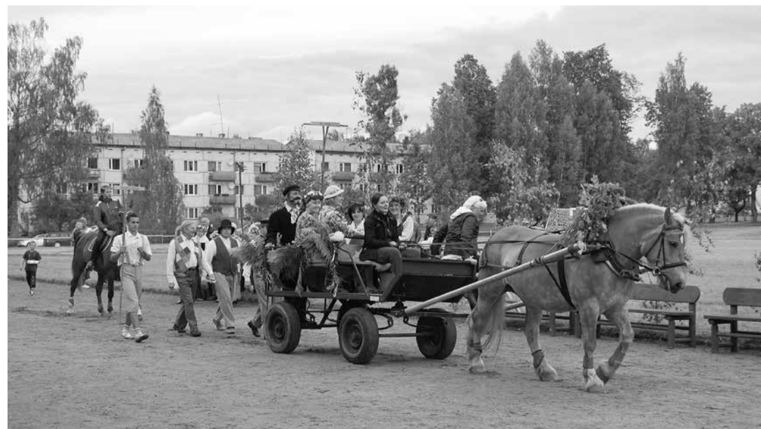
Brauc Trīne ar savu saimi - koncerts var sākties!