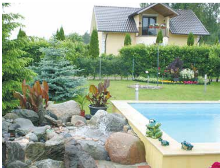
Skultes pagasta Ziemeļblāzmā 232.